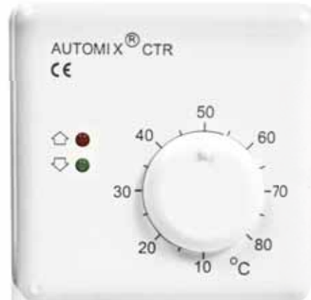
AUTOMIX CTR huoneyksikkö